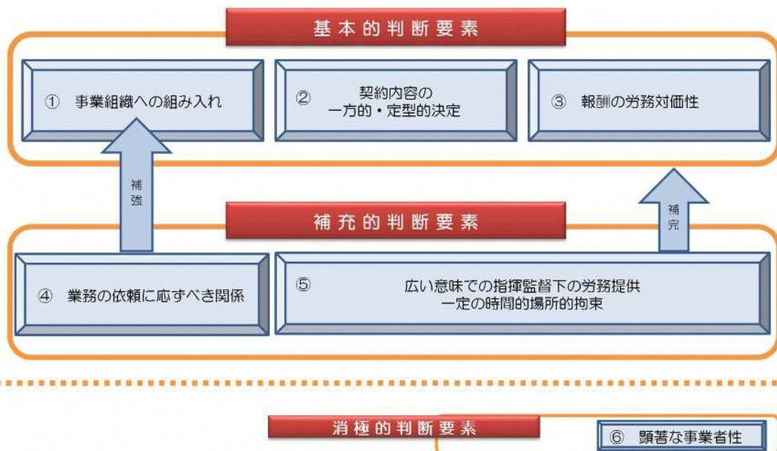
(図3：各判断要素の関係（労働組合法）)

※労使関係法研究会報告書（労働組合法上の労働者性の判断基準について）（平成23年7月）で示された判断要素に基づく。